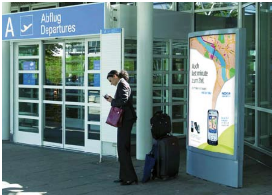
GERMANY AIRPORT NETZWERK Insgesamt 122 Citylight-Poster in unmittelbarer Nähe der Ein- und Ausgänge der Terminals erreichen an den Flughäfen Frankfurt, Hamburg, Hannover und München bis zu zwei Millionen Passagiere pro Woche.

Dass sich hier neben den Passagieren eine zusätzliche attraktive Zielgruppe herausgebildet hat, haben mittlerweile auch die Airports erkannt. Vor allem die großen Flughäfen mutierten in den vergangenen Jahren mehr und mehr zu Erlebniswelten. Während oftmals die interessanten Geschäfte erst hinter den Sicherheitskontrollen und somit nur für die Fluggäste erreichbar sind, baut Frankfurt bis 2012 unterhalb des Terminal 1 eine für alle zugängliche, 6000 Quadratmeter große „Airport City Mall“ mit einem breiten Retail- und Gastronomie-Angebot im mittelpreisigen Segment. Be-