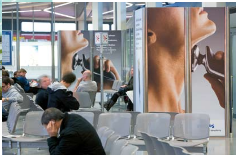
WERBUNG IN WARTESITUATION Philips plädiert am Flughafen Berlin für glattrasierte Männergesichter.