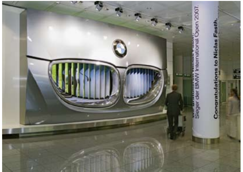
HINGUCKER Der riesige Kühlergrill, mit dem BMW am Flughafen München wirbt.